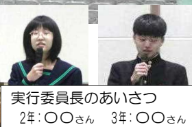
実行委員長のあいさつ 2年:〇〇さん 3年:〇〇さん