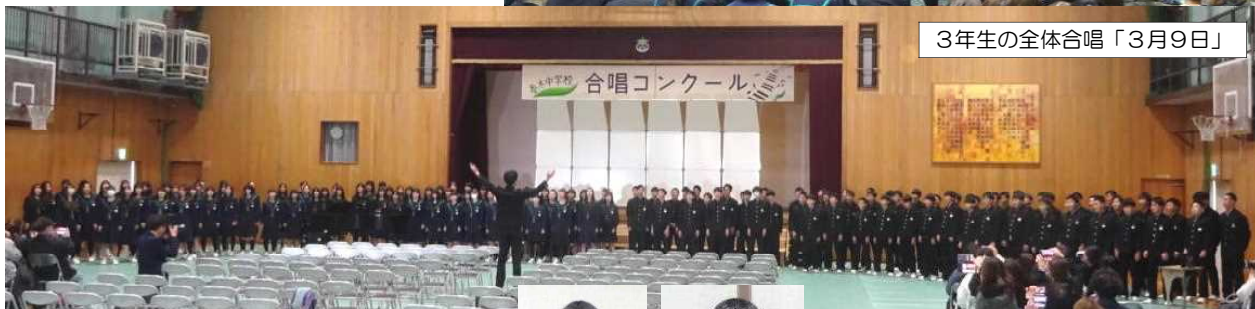
3年生の全体合唱「3月9日」