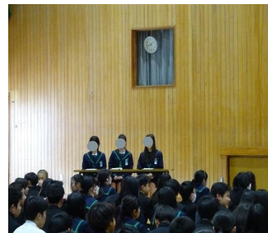
選挙管理委員会のみなさん