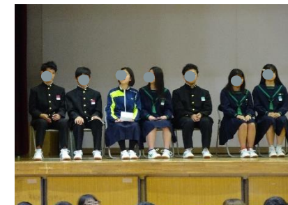
立候補者の皆さん