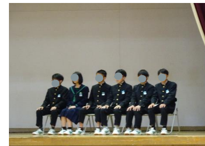
立候補者の皆さん