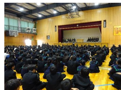
生徒のみなさんの様子

選挙にあたり、とても大切なお話がありました。みなさんもあと数年経つと参政権を得ます。まず今は春木中学校という社会のリーダー選出についてしっかり考える機会でしたね。