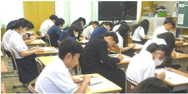
(写真は、12日 3年生音楽のテストの様子)

今まで期末テストで行っていた4教科(音、美、技家、保体)のテストを、期末とは別の日に「4教科テスト」として実施しました。これは、生徒の皆さんの負担を軽減するとともに、4教科のテストにも力を入れてもらおうと始めた取り組みです。